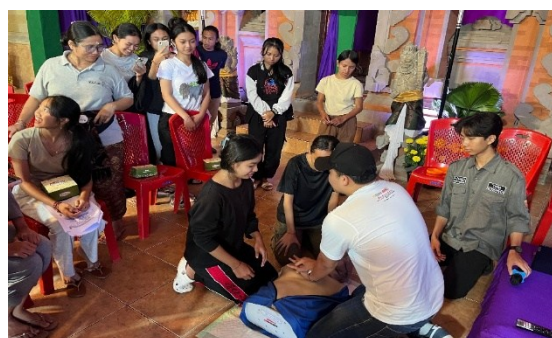
Gambar 2. Pelatihan BHD meliputi teknik RJP