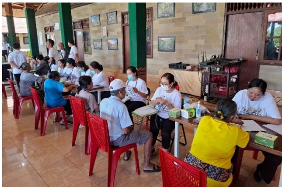
Gambar 4. Pelayanan kesehatan kepada warga