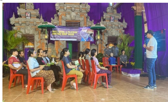
Gambar 1. Penyampaian materi BHD oleh narasumber

Kegiatan penyuluhan dan pelatihan BHD ini dilaksanakan bersamaan dengan kegiatan pelayanan kesehatan gratis kepada warga Desa Penglipuran (Gambar 4). Pemeriksaan yang dilakukan meliputi pengukuran tinggi badan dan berat badan untuk menentukan indeks massa tubuh (IMT), pemeriksaan nadi dan tekanan darah serta skrining kadar gula darah, kolesterol dan asam urat. Jumlah peserta pelayanan kesehatan adalah sebanyak 44 orang dengan karakteristik yang dapat dilihat pada tabel 1.