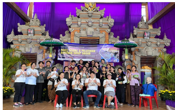
Gambar 7. Tim pelaksana dan peserta baksos

Kegiatan bakti sosial yang dilaksanakan oleh AIPKI Wilayah V di Desa Wisata Penglipuran, Bangli, memiliki kesamaan dengan berbagai program serupa yang dilakukan di lokasi lain di Indonesia.