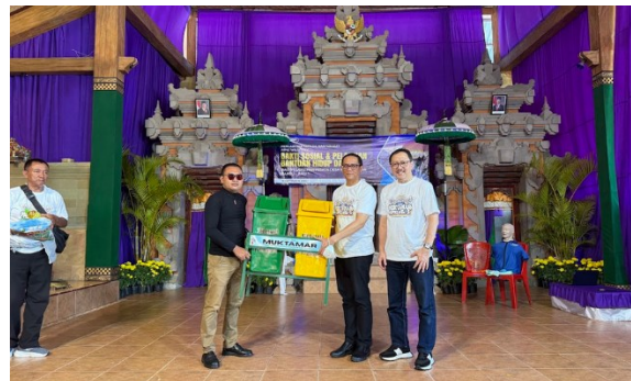
Gambar 6. Penyerahan bantuan