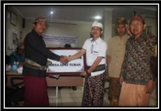
Gambar 4. Serah Terima Papan Nama Kerta Desa Desa Adat Tuban

ruangan khusus untuk kantor Kerta Desa dan perlengkapan ATK yang dapat dimanfaatkan untuk menunjang tugas-tugas administrasi Kerta Desa.