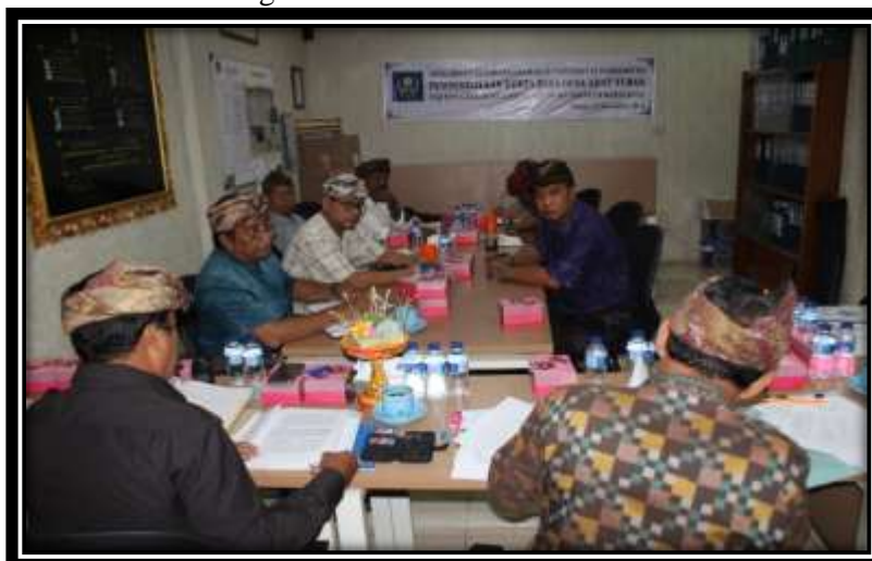
Gambar 2. Kegiatan FGD di Kantor Bendesa Adat Tuban

Tahap lebih lanjut adalah melakukan FGD yang dilaksanakan pada tanggal 13 November 2016 bertempat di Kantor Bendesa Adat Tuban, seperti tampak pada gambar 2 di bawah ini.