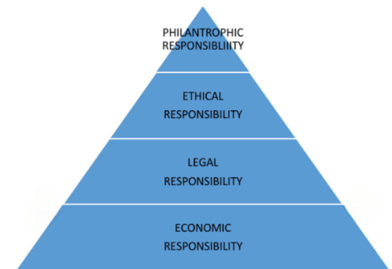
Gambar 2. Carroll's CSR PYRAMID

Dengan berdasarkan pengertian CSR yang dikemukakan oleh Carroll (2004) sebagai, "Corporate Social Responsibility includes the economic, legal, ethical, and voluntary obligations that society expects organizations to fulfill at a particular moment in time. maka piramida akan menjelaskan pandangan masyarakat atas tanggung jawab perusahaan: