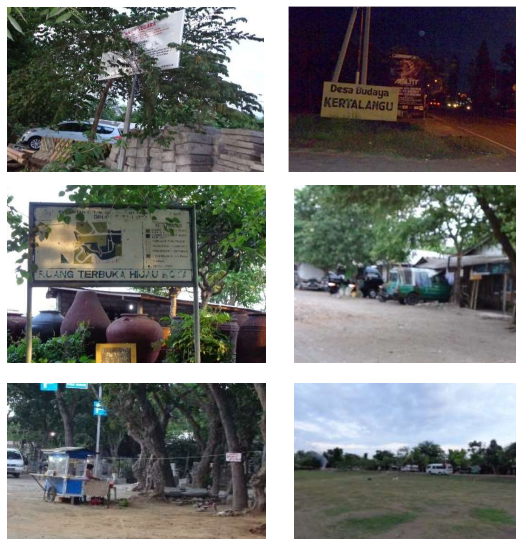
Gambar 2. Pemanfaatan Ruang di Sekitar Patung Ramayana

Sesuai uraian diatas dan metode pembahasan maka dapat dikaji Perubahan kawasan cerita patung Ramayana di Wilayah Desa Kesiman Kerta Langu Denpasar Timur sesuai dengan skop dan masalah yang terjadi adalah sebagai berikut :