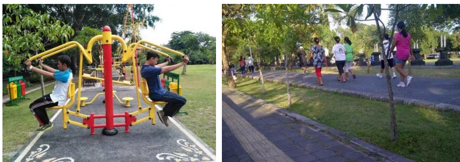
Gambar 3. Area Jogging Track Zona I

dilakukan di lapangan Lumintang (Taman Kota Denpasar) ini di masing – masing zona pengamatan (Zona I-X) kegiatan yang dominan dilakukan di lapangan ini adalah duduk dan berjalan santai. Untuk jenis pakaian yang banyak digunakan adalah kaos kain dengan lengan pendek dan celana kain baik pendek maupun panjang.