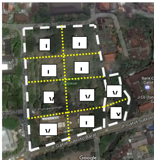
Gambar 1. Pembagian Zona Pengukuran

Untuk titik pengukuran kondisi termal pada masing – masing zona adalah dua titik pengukuran. Dua titik pengukuran dipilih agar dapat mewakili rentang variabel kondisi termal yang ada di masing – masing zona. Hal ini mengingat karakteristik pembentuk ruang luar di masing – masing zona berbeda. Ada yang penuh dengan vegetasi yang rindang dan besar terutama di disisi pinggir lapangan dan ada yang berada pada posisi kurang pohon penayang ( area yang makin dekat dengan bagian tengah lapangan). Maka total titik pengukuran ada 12 titik pengukuran. Sesuai dengan pembagian zona pengukuran kondisi termal, maka penyebaran kuisisioner juga dilakukan pada 10 zona tersebut.