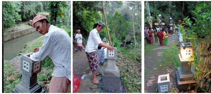
Gambar 5. Penataan pencahayaan dengan lampu taman. Sumber: Raka Gunawarman, Januari 2022