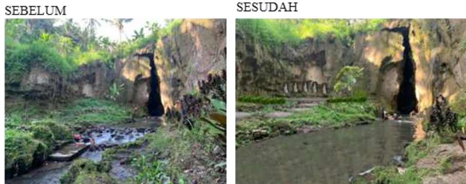
Gambar 8. Penataan Zona Utama Candi Tebing Kelebutan .