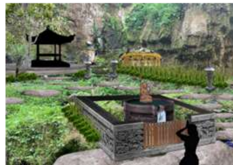
Gambar 7. Penataan Zona Pnegelukan Candi Tebing Kelebutan .