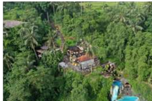
Gambar 4. Penataan Kawasan Beji Bun . Sumber: Raka Gunawarman, Januari 2022