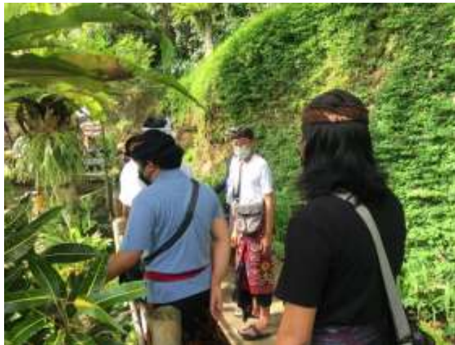
Gambar 3. Proses pengumpulan data awal Beji Bun, Banjar Dukuh Kawan bersama mitra dan mahasiswa