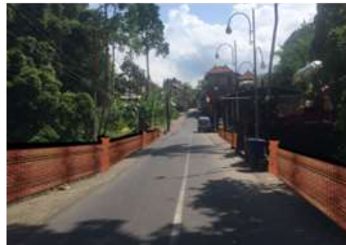
Gambar 12. Penataan Dinding Jalan Perbatasan Desa.

Pelaksanaan program pelatihan, penyuluhan, dan pendampingan oleh kelompok Tim dosen dan mahasiswa bidang ekonomi telah membantu mempersiapkan masyarakat setempat dalam pengelolaan manajemen. Melalui model tata kelola publikasi sederhana yang disiapkan telah membantu kelompok masyarakat setempat dalam proses publikasi DTW religi di desa ini, sekaligus mengetahui peningkatan jumlah pengunjung.