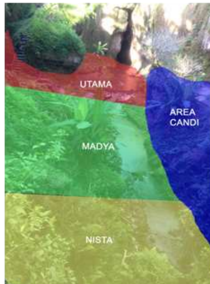
Gambar 6. Eksisting zona Candi Tebing Kelebutan .