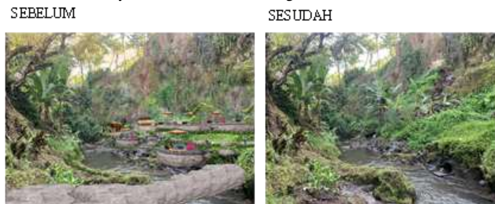
Gambar 10. Penataan Zona Madya dan Nista Candi Tebing Kelebutan .