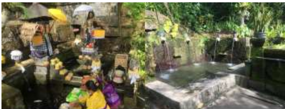
Gambar 2. Beji Bun, Banjar Dukuh Kawan saat piodalan/upacara Sumber: Raka Gunawarman, Januari 2022