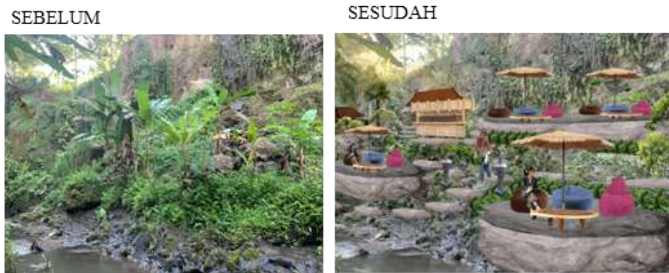
Gambar 9. Penataan Zona Madya Candi Tebing Kelebutan . Sumber: Raka Gunawarman, Januari 2022