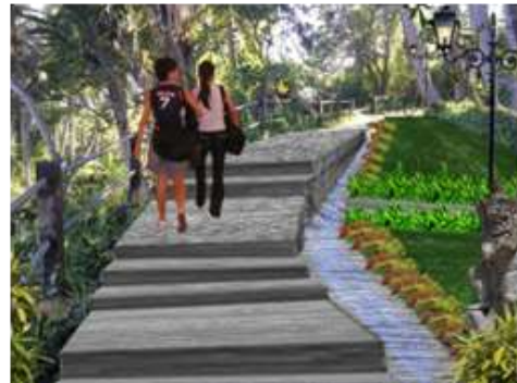
Gambar 11. Penataan Perkerasan-Jalan Menuju Candi Tebing Kelebutan . Sumber: Raka Gunawarman, Januari 2022