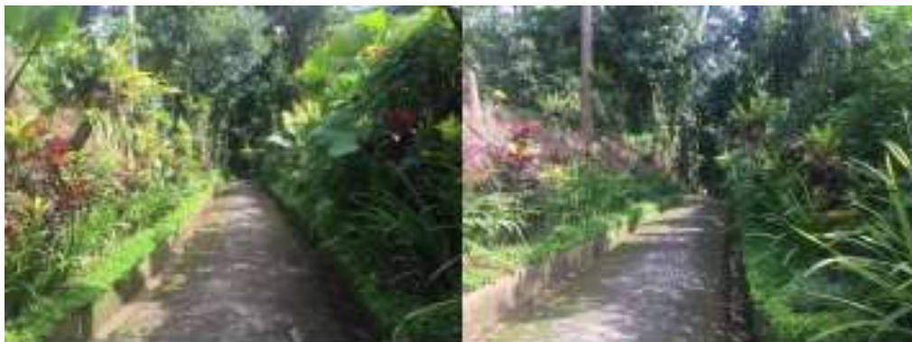
Gambar 1. Suasana jalan menuju Beji Bun, Banjar Dukuh Kawan yang telah tertata

Beji di Desa Pejeng Kawan masih dimanfaatkan sebagai tempat pemandian umum dan sumber air minum bagi masyarakat setempat. Di Bali, beji juga dikenal sebagai tempat untuk melukat yang dipercaya sebagai tempat untuk membersihkan diri dari hal-hal negatif oleh umat Hindu bahkan non-Hindu. Keberadaan beji di Bali tersebut juga menjadi Daya Tarik Wisata (DTW) religi bagi beberapa umat yang percaya atas kasiat air dari setiap beji. Beji di Desa Pejeng Kawan pun memiliki cerita - cerita yang sama, seperti dapat menyembuhkan beberapa penyakit, dan membersihkan diri. Beji dikelola oleh kelompok pengampu atau dikenal sebagai Pangempon Beji. Pangempon Beji ini bertugas sebagai pemelihara dan penanggung jawab tata kelola beji sampai pada upacara/piodalan.