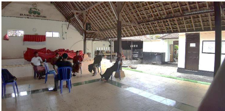
Gambar 3. Area Panggung yang digunakan sebagai area gambelan

Fungsi banjar saat ini diharuskan mampu memfasilitasi kegiatan seni budaya khususnya penyediaan panggung yang sebagai suatu kebutuhan yang penting. Lokasi panggung pada Banjar Pande Kota terletak di bagian selatan Bale Banjar menghadap utara. Area panggung saat ini masih dipenuhi oleh gambelan sehingga ketika ada kegiatan pertunjukan para warga banjar harus memindahkan gambelan yang membutuhkan banyak tenaga, sehingga saran dari kelompok mitra yaitu menyediakan tempat khusus bagi gambelan dan juga panggung agar tidak menghambat aktivitas pertunjukan.