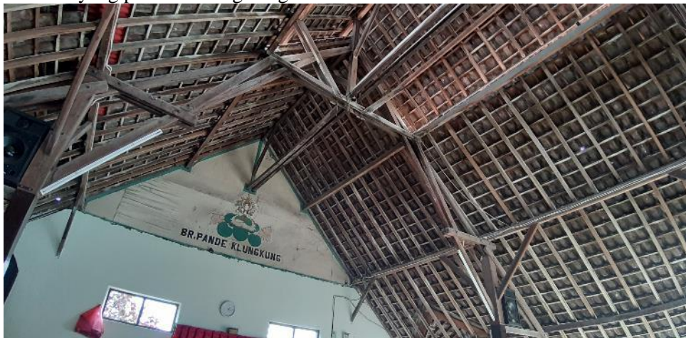
Gambar 7. Struktur atap Banjar Pande Kota

Kondisi atap Banjar Pande Kota kurang memenuhi standar keselamatan dan Kesehatan hal ini dikarenakan adanya beberapa retak pada bagian kolom dan balok struktur sehingga perlu adanya analisis struktur yang pada eksisting bangunan.