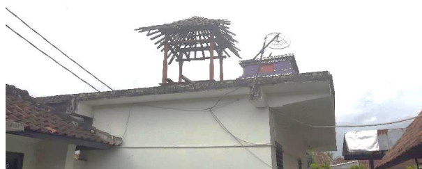
Gambar 5. Kondisi Bale Bengong di lantai 2 toko.

Bale Banjar Pande Kota saat ini memiliki dua toko yang disewakan yang terletak di dalam kawasan Banjar. Kondisi saat ini memperlihatkan kurang idealnya luas dan fungsi yang dirancang pada desain awal yang menyebabkan kurangnya nilai jual dari tempat. Pada lantai dua terdapat bale yang tidak digunakan dan hampir rubuh karena kurang adanya perawatan fisik secara berkala untuk melakukan perawatan.