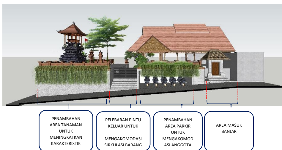
Gambar 11. Fasade Hasil Rancangan Bangunan Banjar Pande Kota