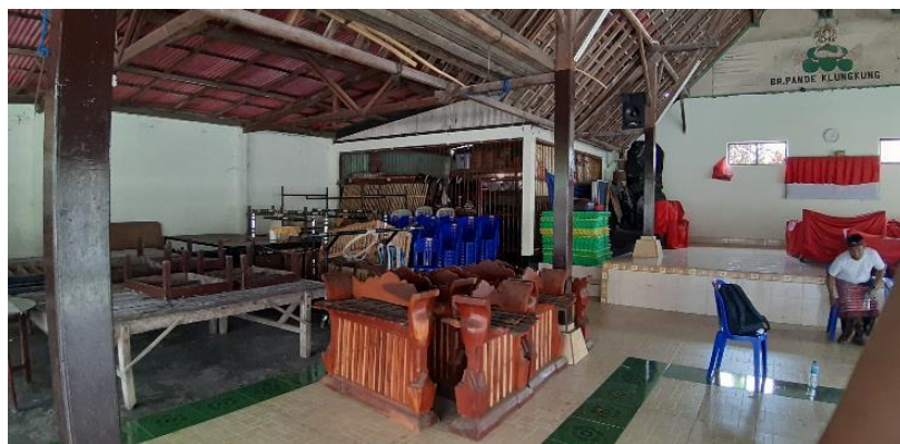
Gambar 4. Area Gambelan yang kurang tertata