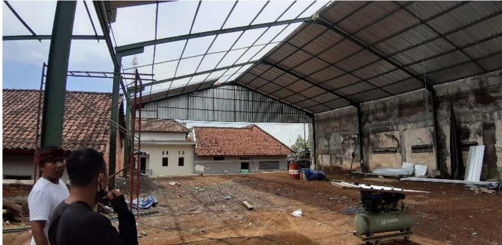
Gambar 9. Kondisi aset Banjar Pande Kota

Banjar Pande Kota memiliki Aset yang ingin dijadikan ruang komersil sehingga perlu kajian untuk memerikan usulan dari potensi lahan dari masukan kelompok masyarakat. Saat ini aset lahan yang dikelola sedang dibangun untuk tempat berjualan. Selain melakukan kajian, tim pengabdian diminta untuk mengawasi pekerjaan atap yang sedang dilakukan yang nantinya dimohonkan untuk mengecek biaya dan laporan dari pihak pembangun.