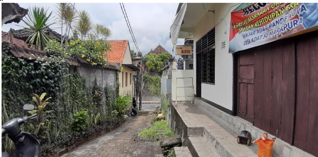
Gambar 8. Akses menuju Banjar Pande Kota

Kondisi jalan menuju Bale Banjar Pande Kota perlu adanya penataan untuk memperindah dan mempercantik kawasan banjar sehingga krama banjar lebih merasa nyaman dan aman. Selain faktor keindahan, penataan wajah jalan merupakan upaya untuk meningkatkan minat pengusaha untuk menggunakan atau menyewa ruang yang ada untuk dijadikan bisnis yang dikelola oleh Banjar Pande Kota.