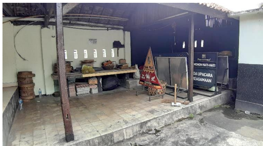
Gambar 2. Kondisi Dapur Banjar Pande Kota

Keadaan Dapur yang digunakan warga banjar untuk mempersiapkan suatu acara masih kurang kondusif karena organisasi keruangan dan furnitur yang tidak sesuai kebutuhan. Selain organisasi tersebut, atap yang mudah terbakar sangat rentan dengan aktivitas yang dilakukan sehingga perlu adanya perencanaan untuk menindaklanjuti aspek keamanan dan kenyamanan pengguna.