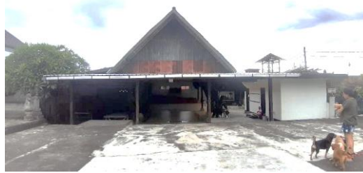
Gambar 6. Kondisi Bale Toko dan Area depan Banjar Pande Kota

Kondisi atap Banjar Pande Kota kurang memenuhi standar keselamatan dan Kesehatan hal ini dikarenakan adanya beberapa retak pada bagian kolom dan balok struktur sehingga perlu adanya analisis struktur yang pada eksisting bangunan.