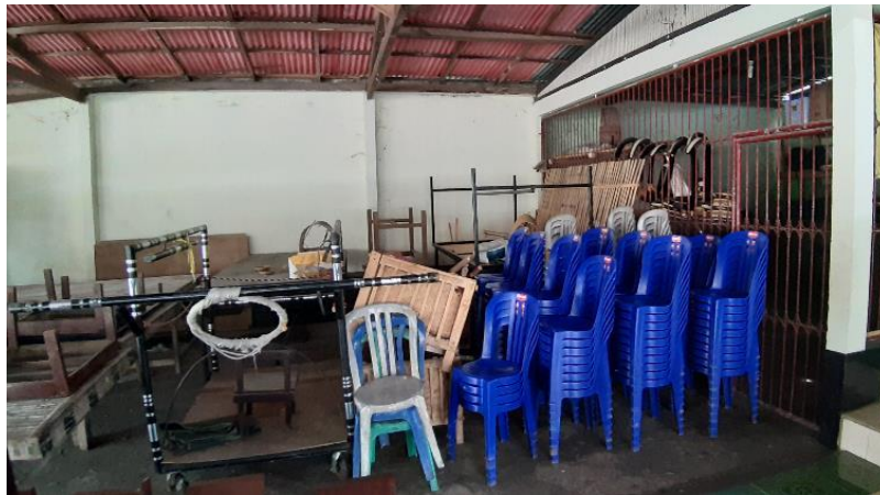
Gambar 1. Kondisi Ruang Penyimpanan Banjar Pande Kota.

Selain aspek komersil suatu Bale Banjar, kebutuhan para warga Banjar dan pemuda Banjar perlu disesuaikan. Hal ini dikarenakan kedua kelompok tersebut membutuhkan ruang untuk kegiatan yang menjad agenda tahunan yang masih kurang tertata dengan baik. Saat ini kondisi ruang penyimpanan masih menjadi satu sehingga banyak barang yang bertumpukan dan sulit untuk terorganisir.