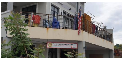
Gambar 2. Area Home Welfare Karunai Illam

Home Welfare Karunai Illam menjadi wadah bagi anak-anak untuk menggapai cita-cita dan membangun masa depan yang lebih baik. Namun, keterbatasan sumber daya dan bahan ajar, khususnya dalam pembelajaran bahasa Inggris, masih menjadi tantangan. Melalui kerja sama dengan Universitas Warmadewa dan Universiti Tunku Abdul Rahman (UTAR), diharapkan kendala tersebut dapat teratasi, sekaligus menanamkan nilai peduli dan semangat berbagi di kalangan anak-anak asuh.