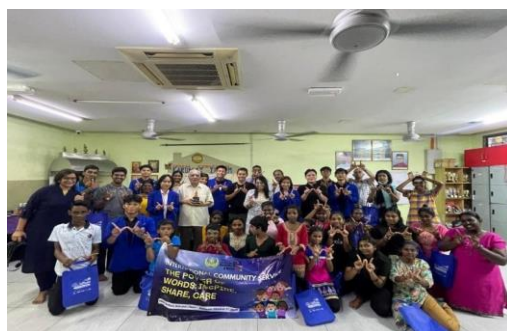
Gambar 3. Anak-Anak Home Welfare Karunai Illam

Untuk mewujudkan terlaksananya program kemitraan ini, maka Tim pengabdian dari Program Studi Sastra Inggris Fakultas Sastra dan Program Studi Manajemen Fakultas Ekonomi dan Bisnis Universitas Warmadewa melakukan penelitian langsung di Home Welfare Karunai Illam yang berlokasi di Malaysia untuk melaksanakan program kemitraan. Dalam kegiatan ini, tim melakukan wawancara guna memahami kondisi dan permasalahan yang dihadapi oleh mitra, yang menghasilkan kesepakatan untuk kerjasama.