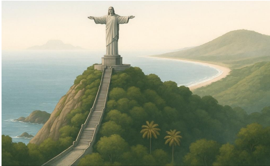
Gambar 2. Cristo Rei dan Lanskap Area Branca

Permasalahan utama mitra yang mendesak untuk dicarikan Solusi adalah sebagai berikut.