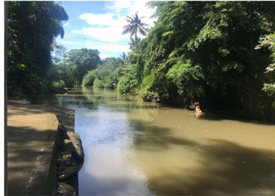
Gambar 9. Tukad Sang-Sang Desa Lebih