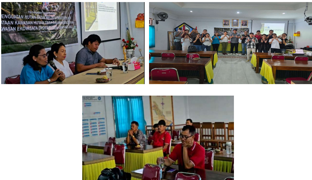
Gambar 3. Kegiatan Sosialisasi Dan Foccus Group Disscusion (FGD)