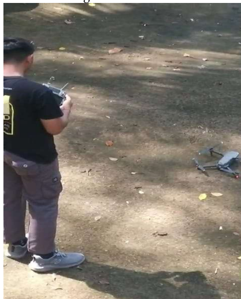
Gambar 2. Survey Pengukuran Dan Pemetaan Lokasi Eksisting Kawasan Wisata Desa Lebih