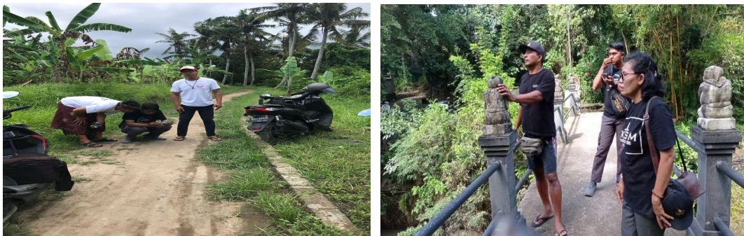
Gambar 1. Survey dan Diskusi Rencana Pengembangan Kawasan Wisata Tim Pengabdi Dengan Perangkat Desa Lebih

Rencana pengembangan fasilitas penunjang wisata kawasan wisata Desa Lebih merupakan kolaborasi antara pemerintah desa dengan tim pengabdian dengan pendekatan Foccus Group Discussion (FGD) .