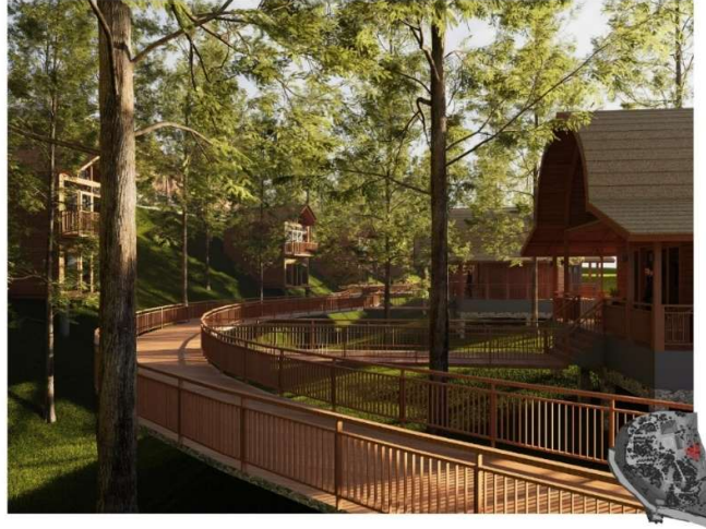
Gambar 13. Glamping , 1br ( Family Type ), 2br ( Couple Type )

Bumi perkemahan ( Glamping ) adalah fasilitas penunjang sebagai pengembangan zona edukasi dan budaya, dimana pengunjung sambil berkemah disugahi konsep edukasi tentang sejarah, nilai-nilai budaya, dan pelestarian lingkungan sekitar. Fasilitas glamping dilengkapi dengan jembatan kayu sebagai akses antar tipe-tipe ruang yang disiapkan terlihat pada gambar 13.