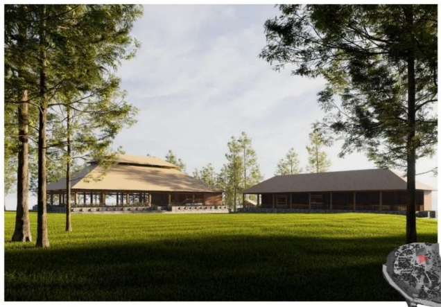
Gambar 14. Ruang Komunitas ( Communal Space )

Sebagai pendukung pengembangan zona komersial, direncanakan fasilitas pendukungnya adalah ruang komunitas ( Communal Space ) untuk penyelenggaraan acara atau event seperti family gathering, wedding, atraksi wisata, stand UMKM dan acara sosial lainnya seperti terlihat pada gambar 14. Communal Space diharapkan meningkatkan perekonomian masyarakat lokal dengan tetap berprinsip pada konsep keberlanjutan.