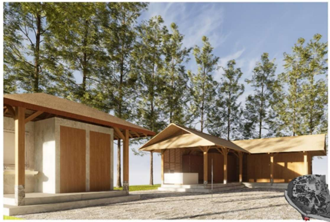
Gambar 6. Registrasi, Loker, Ruang Ganti

Fasilitas penunjang berupa tempat registrasi adalah fasilitas awal yang disiapkan untuk pengunjung sebelum melakukan kegiatan selanjutnya pada Kawasan wisata Desa Lebih dapat dilihat pada gambar 6. Untuk pengembangan zona konservasi, potensi alam berupa sumber mata air, dibuatkan fasilitas penunjang berupa tempat melukat terlihat pada gambar 7 dan setelahnya pengunjung bisa melakukan persembahyangan di Pura Ratu Bajang terlihat pada gambar 8 yang berada di atas Tukad/Sungai Sang-Sang seperti terlihat pada gambar 9. Tukad Sang-Sang selain berpotensi dikembangkan menjadi wisata konservasi, juga berpotensi dikembangkan menjadi fasilitas wisata air berupa river club yang dilengkapi dengan fasilitas restoran, kolam renang, bin bed dan lainnya seperti terlihat pada gambar 10.