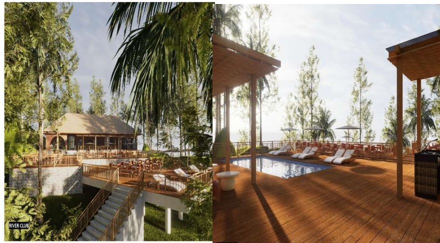
Gambar 10. River Club

Sebagai upaya pengembangan zona wisata aktif dan untuk meningkatkan daya tarik wisata disiapkan fasilitas jalur trekking berupa jogging track yang dilengkapi dengan tempat istirahat ( rest area ) pada jarak tertentu terlihat pada gambar 11 dan lintasan ATV seperti terlihat pada gambar 12 mengelilingi lapangan mini soccer.