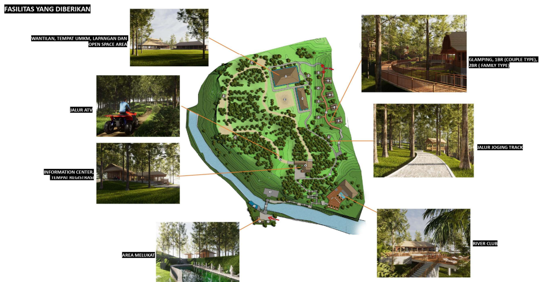
Gambar 5. Detail Masterplan Fasilitas Penunjang Wisata Desa Lebih