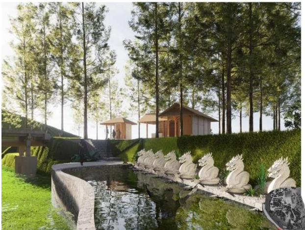
Gambar 7. Tempat Melukat (Holi Water Area)