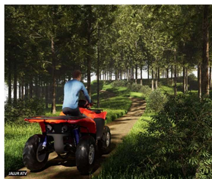
Gambar 12. Jalur ATV