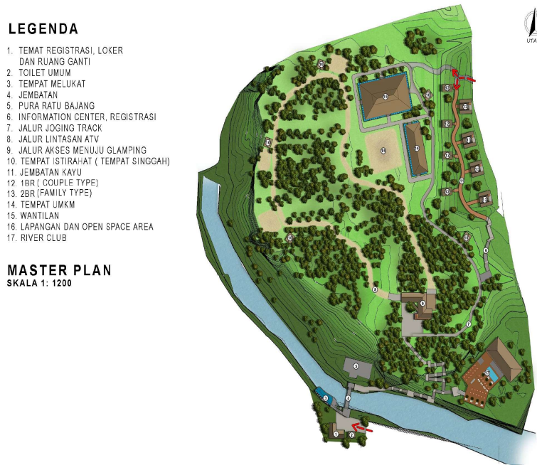
Gambar 4. Layout Masterplan Fasilitas Penunjang Wisata Desa Lebih