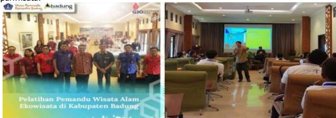
Gambar 2. Pelatihan Pemandu Wisata Ekowisata di Kabupaten Badung

Dalam pengembangan objek wisata Bagus Agro Pelaga, kepemimpinan yang ada di Bagus Agro Pelaga dalam hal pengembangan pariwisata yaitu kepemimpinan kolaboratif ( collaborative leadership ). Dalam kepemimpinan dari pemerintah seperti ijin regulasi/kebijakan yaitu adanya Peraturan Bupati Badung Nomor 47 Tahun 2010, tentang Penetapan Kawasan Desa Wisata di Kabupaten Badung, Desa Pelaga ditetapkan sebagai wilayah desa wisata. Dari adanya penetapan peraturan tersebut maka terdapat perkembangan pariwisata khususnya di Desa Pelaga yang dapat memberikan dampak yang positif bagi masyarakat sekitar. Selain itu dukungan melalui pelatihan dan pemasaran merupakan motivasi pemerintah dalam pengembangan wisata. Peran pemerintah mengadakan pelatihan pemandu wisata alam ekowisata yang ada di Kabupaten Badung yang dilaksanakan di objek wisata Bagus Agro Pelaga, yang diselenggarakan oleh Dinas Pariwisata Kabupaten Badung pada tanggal 27 September 2022. Pelatihan ini bertujuan meningkatkan penguasaan dan pengetahuan serta ketrampilan bagi pemandu tentang wisata alam ekowisata. Berikut merupakan gambar kegiatan pemerintah yang menjadi mediator sekaligus fasilitator dalam pengembangan pariwisata: