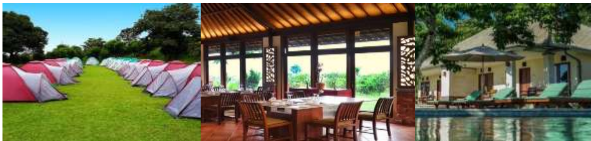
Gambar 3. Pembangunan Fisik Dari Pengelola Bagus Agro Pelaga

Jadi kolaborasi pemerintah dengan swasta dalam kepemimpinan cukup terealisasi dalam regulasi/kebijakan, pemasaran, dan pelatihan. Selanjutnya kepemimpinan dari sektor swasta dalam pengembangan sangat berperan penting dalam pembangunan fisik dari Bagus Agro Pelaga. Pembangunan fisik yang dimaksud pembangunan rumah penginapan, restoran, wantilan, gazebo, jogging track , camping ground dan tempat aktivitas lainnya. Contohnya seperti beberapa gambar: