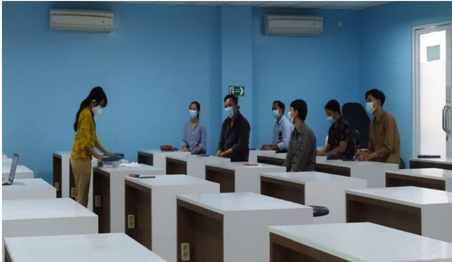
Gambar 1. Foto pelaksanaan kegiatan

Mitra adalah pelaku pariwisata di Bali sebanyak 7 orang. Kegiatan berlangsung dengan lancar dan melebihi jumlah awal mitra yang ditargetkan yaitu sebanyak 5 orang. Mitra didominasi oleh jenis kelamin laki-laki sebanyak 6 orang dan wanita sebanyak 1 orang. Usia mitra yang termuda adalah 19 tahun dan yang paling tua adalah 53 tahun. Pelaksanaan kegiatan edukasi menerapkan protokol kesehatan yang direkomendasikan seperti tampak pada Gambar 1. Pada akhir kegiatan dilakukan pemberian masker dan handsanitizer , sehingga dapat dipergunakan oleh mitra dalam melaksanakan aktivitas sehari-hari dengan tetap menerapkan protokol kesehatan yang ketat.