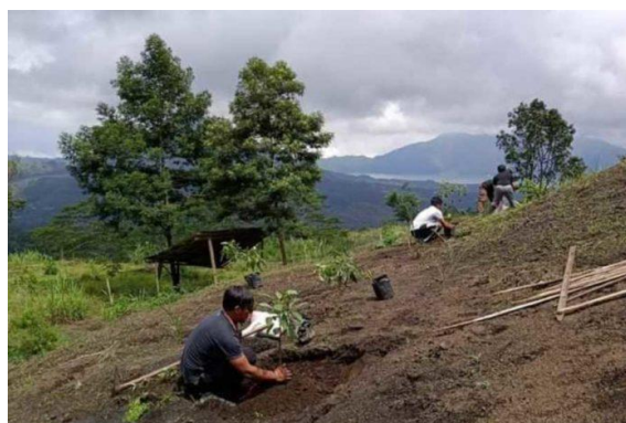
Gambar 3. Perkebunan Alpukat Hass di Desa Batur Utara

Berdasarkan hasil diskusi, mitra ibu-ibu kader posyandu ini memiliki pekerjaan yang beragam. Beberapa dari mereka adalah pekerja perkebunan dan pegawai swasta, sedangkan sebagian besarnya adalah ibu rumah tangga (IRT). Secara umum, perekonomian keluarga mitra masih tergolong menengah ke bawah. Dengan pendapatan keluarga yang fluktuatif, mitra mengaku agak kesulitan dalam mengatur keuangan, terutama untuk tabungan dan dana darurat. Berdasarkan hasil diskusi, mitra berharap dapat diberikan informasi mengenai tips pengelolaan keuangan sederhana skala rumah tangga, terutama jika besaran pemasukan per bulannya tidak tetap, sehingga mereka dapat mengatur keuangan keluarga dengan lebih baik. Selain itu, mitra juga berharap diberikan wawasan mengenai ide-ide usaha sederhana yang dapat mereka lakukan untuk membantu perekonomian keluarga.