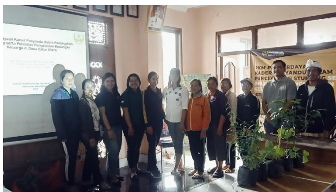
Gambar 6. Pemberian bantuan dan foto bersama

Hasil evaluasi berupa analisis nilai pretest dan posttest menunjukkan bahwa telah terjadi peningkatan pengetahuan mitra mengenai topik stunting dan pengelolaan keuangan sederhana. Hal ini dapat dilihat dari terjadinya peningkatan nilai dari pre- dan posttest nya yaitu dari rata-rata 66/100 menjadi 82/100. Hasil monitoring kegiatan menunjukkan bahwa bantuan alat berupa APE, timbangan gantung balita, tensimeter, dan lainnya, telah dimanfaatkan oleh mitra dalam kegiatan posyandu mereka (Gambar 7). Bantuan berupa susu formula juga telah dibagikan kepada beberapa balita yang dirasa membutuhkan (Gambar 8). Hasil diskusi yang dilakukan saat monitoring menunjukkan bahwa kegiatan PKM ini sangat bermanfaat dan membantu mitra. Mitra berharap kegiatan seperti ini dapat kembali diadakan di masa mendatang sehingga komunikasi antara mitra dan perguruan tinggi tetap terjalin dengan baik.