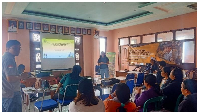
Gambar 5. Pemaparan materi