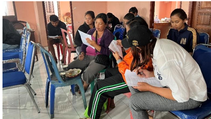
Gambar 4. Pelaksanaan pretest

Setelah persiapan administrasi serta persiapan alat dan bahan selesai dilakukan, selanjutnya dijadwalkan kegiatan utama PKM berupa pemberian penyuluhan dan pelatihan sederhana yang dilakukan pada hari Sabtu, 3 Februari 2024 di aula Kantor Desa Batur Utara. Kegiatan tersebut dihadiri oleh seluruh tim PKM, perbekel Desa Batur Utara, koordinator posyandu Desa Batur Utara, serta lima orang kader posyandu. Kegiatan diawali dengan sambutan oleh perbekel, diikuti dengan pemaparan singkat mengenai program PKM sebagai bagian dari Tri Dharma Perguruan Tinggi. Kegiatan kemudian dilanjutkan dengan pemberian pretest kepada mitra berupa 10 multiple choice questions sehingga dapat diperoleh data awal mengenai Tingkat pengetahuan mitra terkait materi yang akan diberikan (Gambar 4). Selanjutnya, dilakukan pemaparan materi dan pelatihan mengenai stunting , cara pemanfaatan ikan mujair sebagai MP-ASI, serta pengelolaan keuangan sederhana dan pemberian beberapa ide-ide usaha rumahan (Gambar 5). Setelah pemberian materi selesai dilakukan, kader kembali diberikan soal posttest untuk mendapatkan data tingkat pengetahuan mitra setelah pemaparan materi. Kegiatan diakhiri dengan pemberian bantuan berupa susu formula, timbangan gantung balita, timbangan berat badan dan tinggi badan, alat peraga edukatif (APE), tensimeter, dan termometer (Gambar 6).