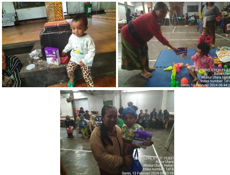
Gambar 8. Pembagian bantuan susu formula